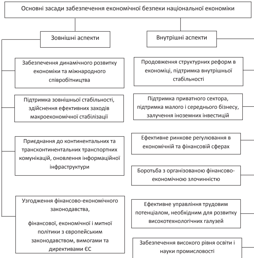
Рис. 2. Частка витрат на НДДКР (% до ВВП) і обсяг ВВП (тис. дол. на душу населення) у розвинутих країнах світу та Україні