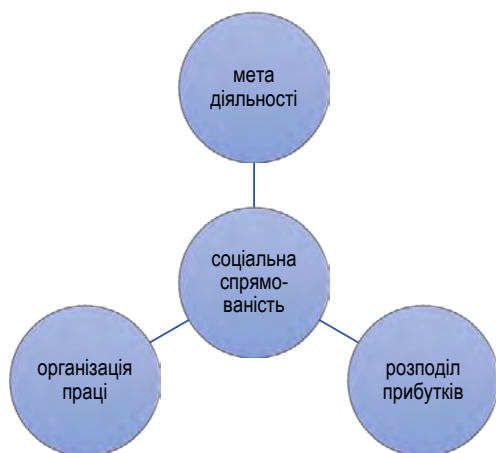
Рис. 1. Ключові елементи СП в нормативних документах країн-членів ЄС

Окрім того, спільні ознаки знаходимо у системі державного управління розвитком даної галузі. Зокрема,