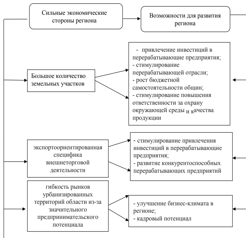
Рис. 3. Возможности для развития перерабатывающих предприятий благодаря сильным экономическим сторонам региона