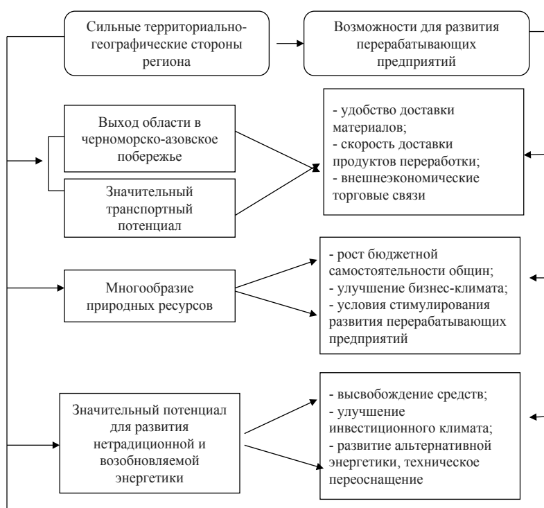
Рис. 1. Возможности для развития перерабатывающих предприятий благодаря территориально-географическому положению региона

Область имеет значительный потенциал для развития нетрадиционной воспроизведенной энергетики, что может способствовать высвобождению средств для улучшения инвестиционного климата, проведе-