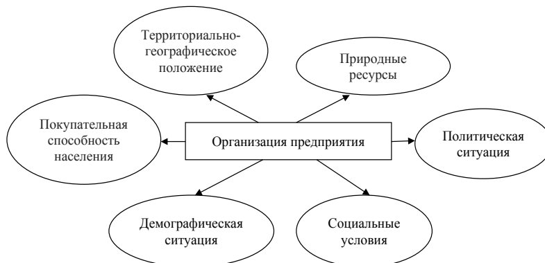
Рис. 4. Территориально-ориентированное управление перерабатывающим предприятием на этапе организации

На этапе развития предприятия критерием выступает соответствие стратегии регионального развития. Данная стратегия – составная часть стратегии развития государства и поэтому должна соответствовать ее основным направлениям и целям. Большую роль здесь играют территориальные общины как учредители и практики стратегий. Если деятельность предприятия соответствует основным направлениям развития, определенных стратегиями развития, то перерабатывающее предприятие данного региона получит под-