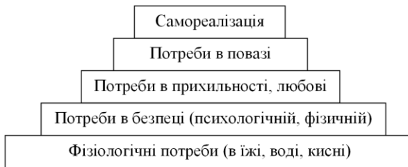
Рис. 1. Ієрархічна піраміда потреб за А. Маслоу

емоційних та вольових навичок для досягнення ним значних цілей і задоволення життєвих потреб.