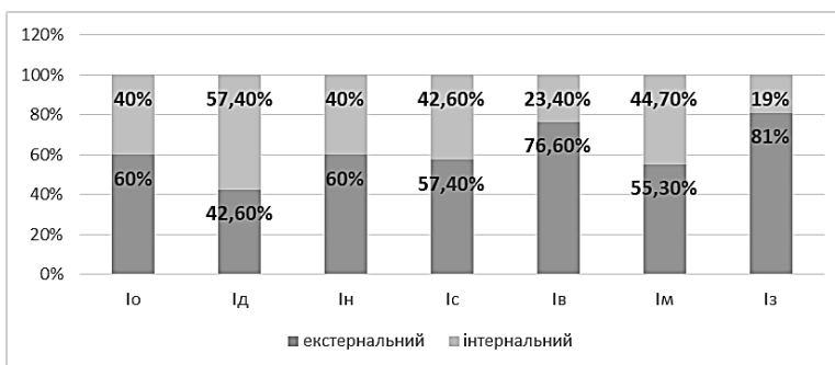
Рис. 1. Відсоткове співвідношення рівня суб'єктивного контролю за опитувальником УСК

Вивчаючи рівень усвідомленості й осмисленості власної відповідальності за життєві результати за «Методикою діагностики рівня суб'єктивного контролю» (УСК) Дж. Роттера, було з'ясовано, що за всіма шкалами, окрім інтернальності в області досягнень, домінують показники екстернального локусу контролю (рис. 1).