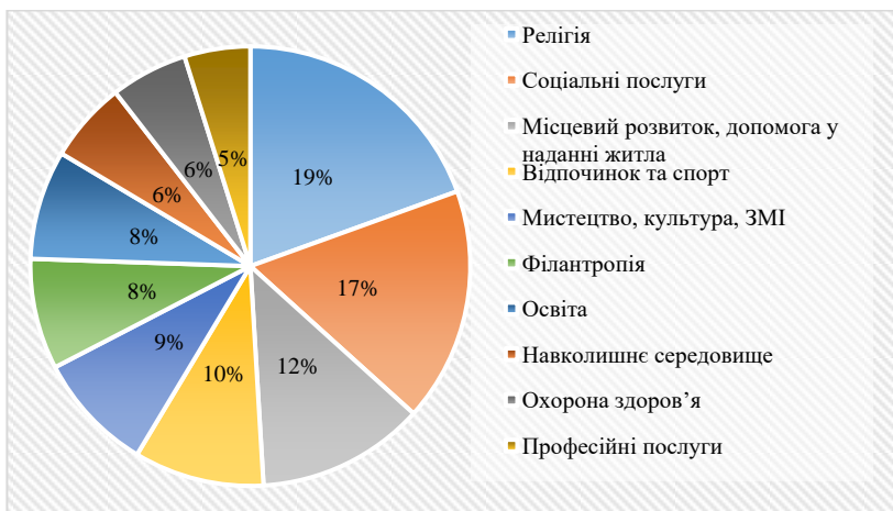
Рис. 1. Секторальна структура діяльності асоціацій без утворення юридичної особи у 2020 р., %