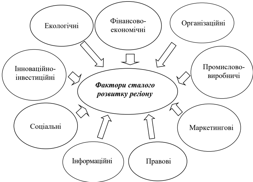
Рис. 1. Фактори сталого розвитку регіону