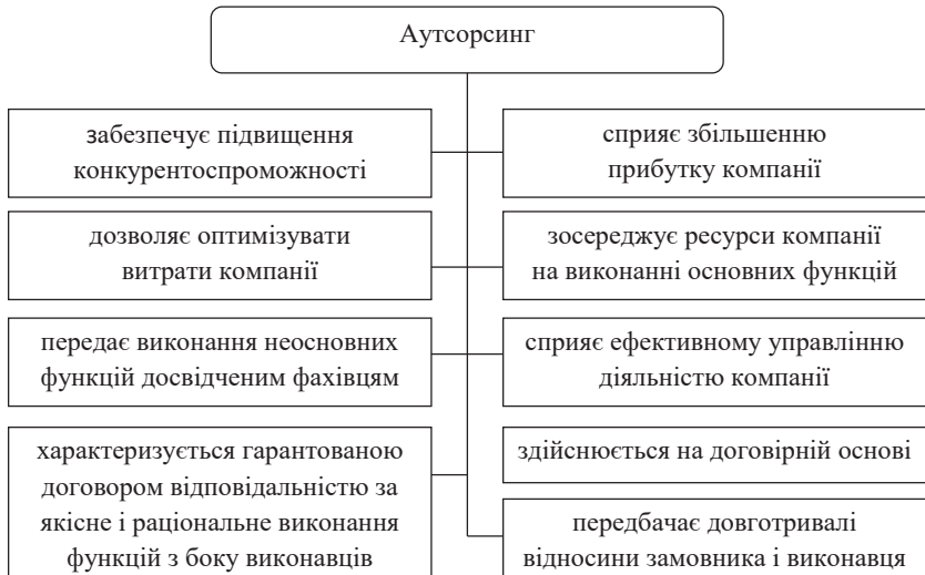
Рис. 2. Характерні риси аутсорсингу

Аутсорсинг бухгалтерського обліку є окремим видом аутсорсингу бізнес-процесів, одним із способів облікового забезпечення діяльності