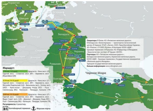
Рис. 2. Via Carpatia: держави-учасниці та основні транспортно-логістичні маршрути 13

далі до Умані постає цілком логічним продовженням проекту. Елементом системи транспортно-логістичної мережі в регіоні буде, зрештою, запланована вже сьогодні автомагістраль ГО (Гданськ – Одеса), яка проляже від Гданська через Люблін та Замостя і до Львова, а потім до Тернополя, Хмельницького, Вінниці та Умані, де з'єднається з автострадою Київ – Одеса. ЄС уже пообіцяв надати фінансову підтримку цьому проекту 12 .