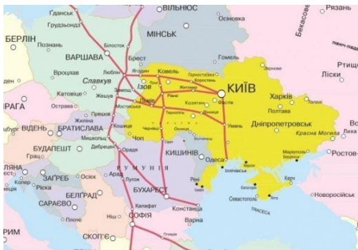
Рис. 3. Via Carpatia: участь України 14