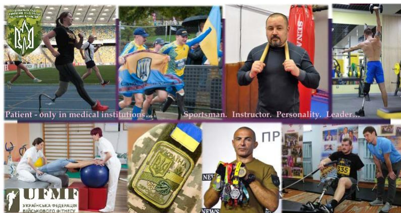
PATIENTS OR CONSUMERS OF MODERN PHYSICAL AND SPORTS SERVICES, CLIENTS

випробуваного у медико-біологічних дослідженнях; знаходиться під медичним спостереженням; споживає медичних і пов'язаних з ними послуги незалежно від стану його здоров'я». Навпроти, за «Вікіпедією» поняття «клієнт» (від лат. cliens, cliens – «той, що слухає») розглядається як «споживач, який, в силу певних обмежень, змушений залежати від постачальника»; але у психології, соціальній роботі та інших немедичних галузях, людина не є пацієнтом. За «Словником української мови» це постійний відвідувач, замовник, покупець тощо.