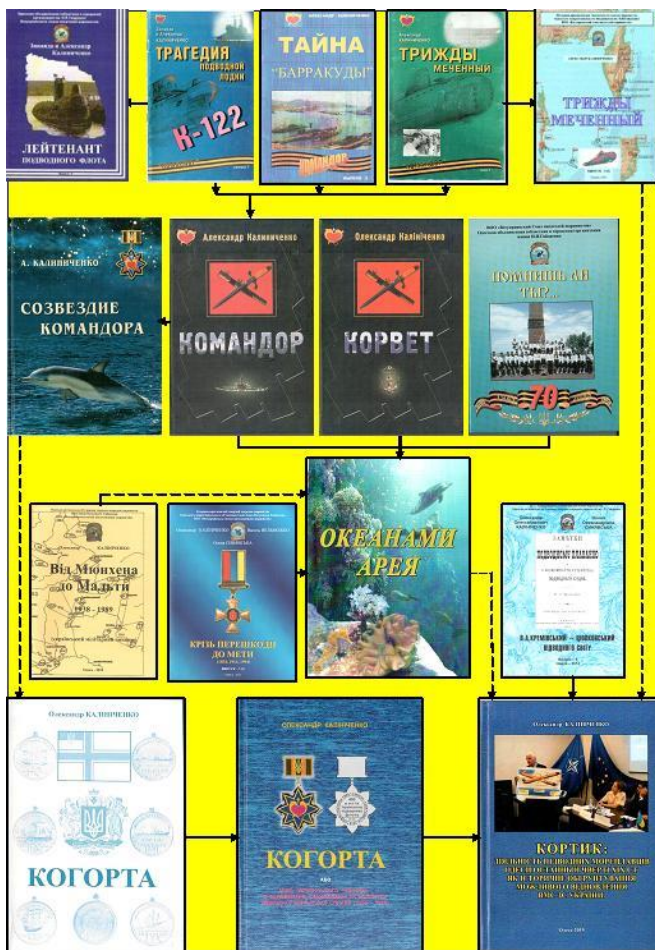
Рис. 2. Від мемуарних спогадів до наукових праць

підтвердження своїх практичних напрацювань, зрештою, дисертаційним дослідженням (див. рис. 2).