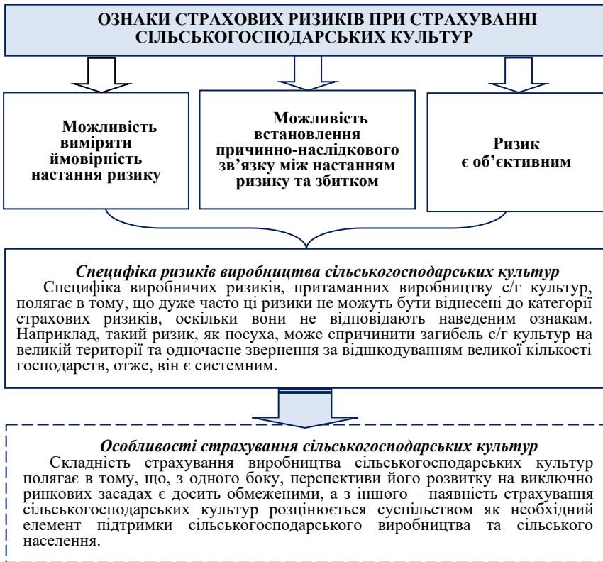
Рис. 2. Специфіка ризиків та особливості страхування сільськогосподарських культур

Для успішного управління ризиками виробництва сільськогосподарських культур існують стратегії, спрямовані на зменшення їх негативного впливу на доходи сільськогосподарського виробництва.