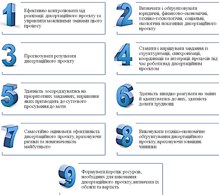
Рис. 1. Ранжування за рівнем значущості компетентностей, які повинні бути сформовані у аспірантів для успішного написання і реалізації дисертаційного проєкту

Питання 6. Виберіть з числа перерахованих форм і метод ті, які ефективно сприяють підготовці майбутніх докторів філософії до написання і реалізації дисертаційного проєкту. Найбільш ефективними формами і методами підготовки до написання і реалізації дисертаційного проєкту з числа запропонованих респонденти вважають: