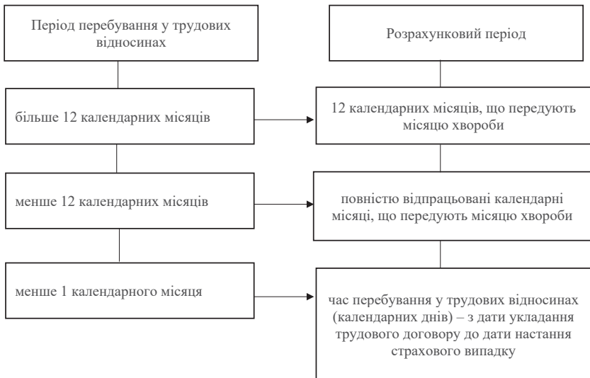
Рис. 3. Вплив перебування у трудових відносинах на розрахунковий період