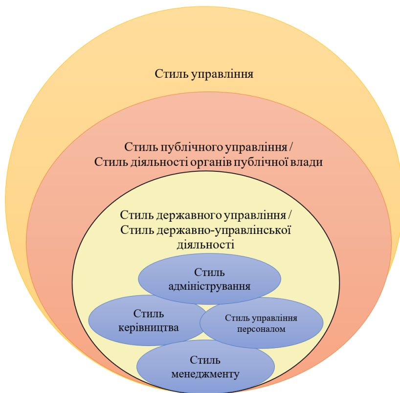
Рис. 2. Схема ієрархічного взаємозв'язку основних категорій, що застосовуються для трактування поняття стилю в публічному управлінні

адміністрування пов'язана із запровадженням менеджменту в діяльність органів влади (рис. 2) 11 .