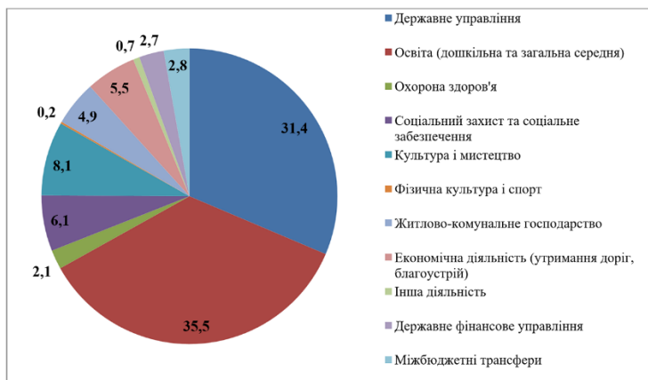
Рис. 2. Структура видатків бюджету Литовезької ОТГ на 2021 р., %

Основними розпорядниками коштів громади виступають Литовезька сільська рада (94,4 %) та відповідний фінансовий державний орган Володимир-Волинського району (5,6 %), який відповідає за державні кошти, їх надходження та цільове використання. В структурі видатків значну питому вагу займають кошти, які виділяються на організаційне, інформаційно-аналітичне та матеріально-технічне забезпечення діяльності сільської ради – 4969,3 тис. грн (31,4 %). Найбільший відсоток – 35,5% займають кошти, що використовуються на освіту – 5605,2 тис. грн, з яких надання дошкільної освіти вартує 2782,7 тис. грн (17,7 %) та надання загальної середньої освіти 2822,5 тис. грн (17,8 %). Із загальної суми видатків (15811,9 тис. грн) 15460,9 тис. грн – це кошти, які акумулюються на загальному рахунку (97,8 %) та 351,0 тис. грн (2,2 %) – на спецрахунку (рис. 2).