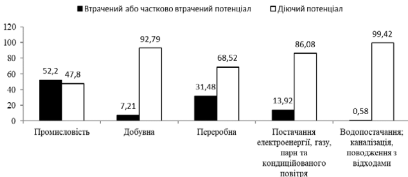
Рис. 2. Втрачений виробничий потенціал на постраждалих від військової агресії територіях України, у відсотках до обсягу реалізованої продукції в промисловості України 2021 року