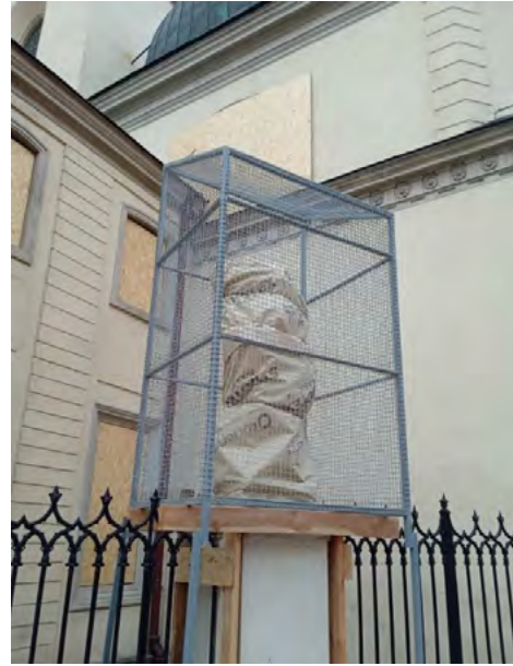
Рис. 1. Львів. 2022 р. Захист статуй собору Святого Юра у Львові (ліворуч) 101 та катедрального костелу Успіння Діви Марії (праворуч)