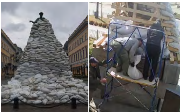
Рис. 2. 2022 р. Захист пам'ятників першому міському голові Одеси Дюку де Рішельє (ліворуч) 102 та судовому експерту та вченому у галузі судової експертизи Миколі Бокаріуса у Харкові (праворуч) 103

Надвеликі об'єкти, обкладання яких вимагало б надзвичайної кількості мішків з піском, які у короткі строки та з обмеженою наявністю розсипчастих гірських порід забезпечити не вдавалось, прикривали опалубними листами. Так, наприклад, був захищений пам'ятник Володимирі Великому у Києві. Будівельники, залучені до робіт, зробили навколо