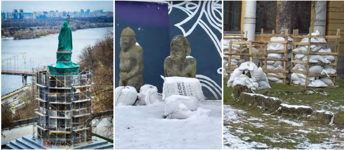
Рис. 3. 2022. Пам'ятник Володиміру Великому (ліворуч) 105 та Кам'яні скульптури «половецькі баби» у Дніпрі (по центру і праворуч) 106

попадання, то щіпочки з ОСП (ДВП, ДСП) залишаються в мінваті. Якщо немає можливості дістатися до вітража ззовні, але є можливість добратися зсередини, то вартує поставити захист зсередини. Якщо буде ударна хвиля з натиском на вітраж, то має бути площина, на яку він має спертись. В цьому випадку вітраж може трохи погнути, але збережеться. Якщо немає можливості захистити вітраж зовні і зсередини є ще третій варіант – прозорим скотчем по діагоналі, вертикалі, горизонталі позаклеювати скляну поверхню, щоб вона трималася купи. При цьому вітраж все одно пошкодиться, але клейка стрічка не дасть йому розлетітись на шматки. Тоді буде дуже довга робота для реставраторів, але це принаймні може бути ще щось позбирати» 107 .