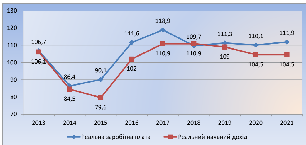
Рис. 3. Зміна реальної заробітної плати та реального наявного доходу населення України, відсотків до попереднього року