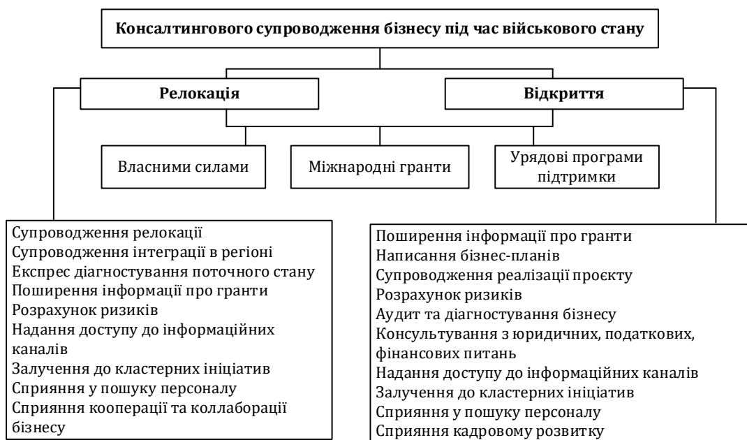
Рис. 4. Зміст консалтингового супроводження під час військового стану в Україні

роз'яснення можливостей приєднання до кластерних ініціатив, допомога у обранні локації;