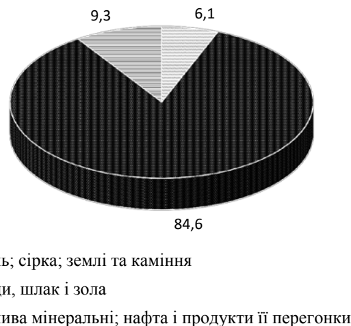
Рис. 3. Структура експорту товарної групи «Мінеральні продукти» у 2021 році

Значна частка експорту сировини позиціонує країну як сировинний придаток для світової економіки, а «залежність від світової кон'юнктури, цін на нафту і газ робить національного виробника вразливим» 16 . Така структура експорту-імпорту демонструє недо-