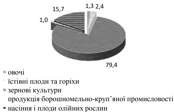
Рис. 2. Структура експорту товарної групи «Продукти рослинного походження» у 2021 році

На товарну групу «Продукти рослинного походження» припадала майже четверта частина всього експорту. Значну частку цієї групи традиційно становив експорт зернових культур (79,4% у 2021 р.) та насіння і плодів олійних рослин (15,7% у 2021 р.) (рис. 2).