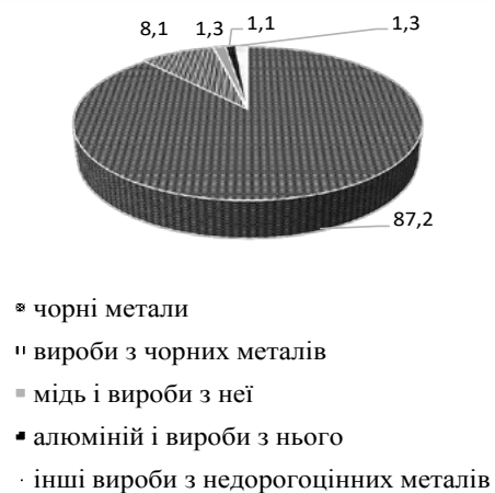
Рис. 4. Структура експорту товарної групи «Недорогоцінні метали та вироби з них» у 2021 році

ліки стратегічного управління економікою, які послабили її позиції у світовій економіці, поставили у залежність від інших держав, навіть, від країни-агресора. Україні потрібно було ще з початку війни у 2014 році припинити експортно-імпортні операції з Російською Федерацією, натомість, як зазначає автор, «вона є третім торговельним партнером України, що досить парадоксально, зважаючи на те, що Україна і Росія фактично вже сьомий рік перебувають у статусі неоголошеної війни» 17 .