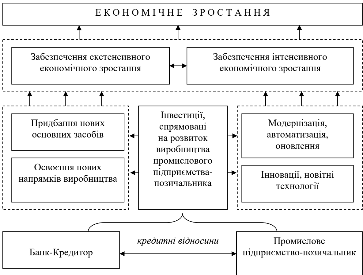
Рис. 2. Влив банківського кредитування промислових підприємств на економічне зростання

кредитування промислових підприємств здатне впливати на показники економічного зростання національної економіки, а отже, на стан макроекономічного середовища.