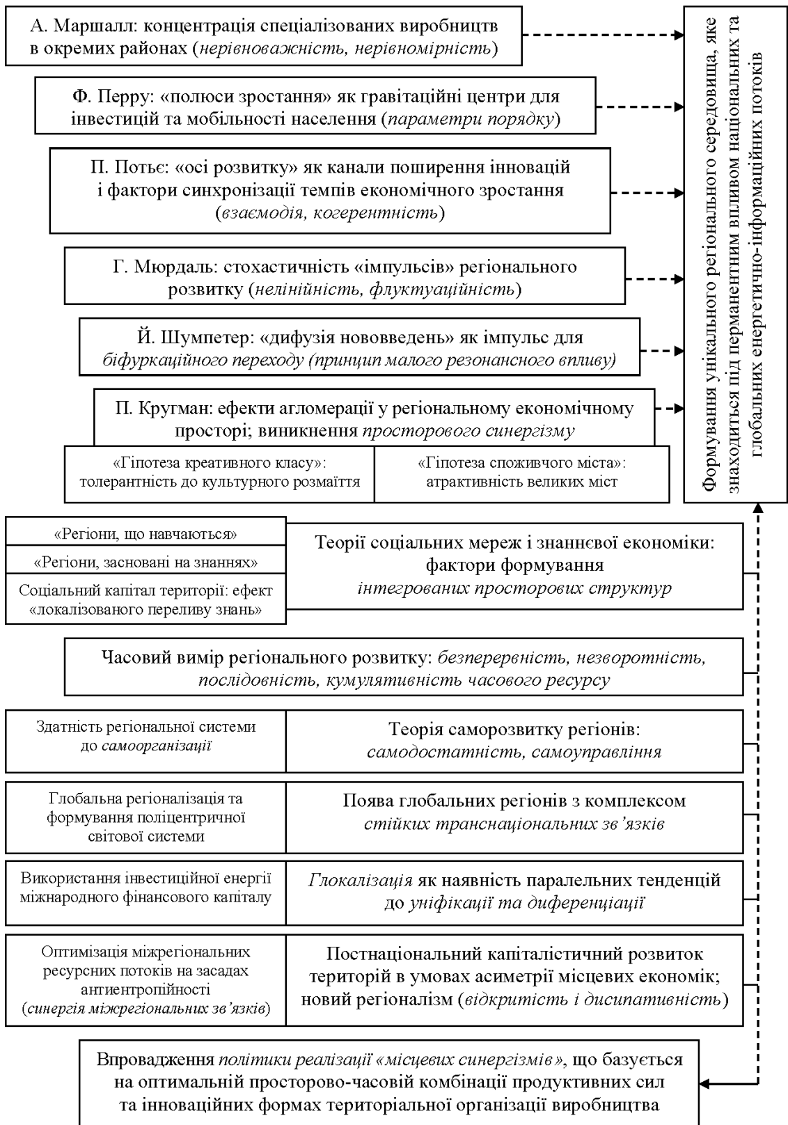
Рис. 1. Основні віхи у становленні синергетичного підходу до тлумачення розвитку регіонів як складних систем, здатних до самоорганізації