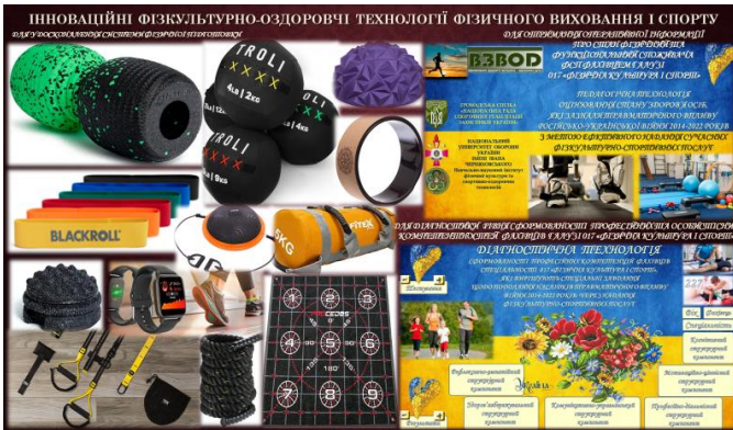
Рис. 2. Приклади використання інноваційних технологій в галузі ФКіС

Розповсюдження набув проект «Активні парки», який має на меті популяризацію ЗОЖ; зацікавленість, свідоме та вмотивоване заняття різними видами ФКіС, із використанням інтерактивних додатків у смартфонах (можливість самостійного тренування за спеціальними підказками, які створені відомими особистостями) [1]. Здобувачі вищої освіти (спеціальності 017) під час дистанційного навчання виконували спеціальні завдання, які потім продемонстрували в презентаціях PowerPoint; створювали фото-, відео-заняття (реабілітаційного та оздоровчого спрямування); вчилися проводити тренування в on-line форматі; залучалися до спеціалізованих тематичних семінарів, тренінгів, круглих столів; здійснювали опитування через Google-Форми [4; 6].