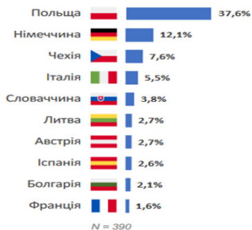
Рис. 1. Топ 10 країн, в які виїхали вимушені переселенці з України 7

Зауважимо, що починаючи від 24 лютого 2022 року відбулося декілька потужних хвиль інтенсифікації міграційних процесів. Перша хвиля (наприкінці лютого 2022 року) пов'язана із початком війни в країні; друга хвиля (початок березня 2022 року), пов'язана з активізацією жорстких бойових дій на північно-східному напрямку; третя хвиля (середина квітня 2022 року) пов'язана із інтенсифікацією військових дій на сході та півдні країни.