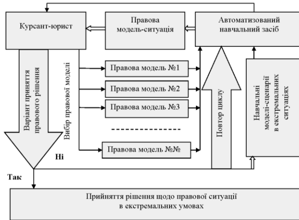
Рис. 2. Узагальнений алгоритм прийняття рішення щодо правової ситуації в екстремальних умовах під час проведення самостійної підготовки курсантів-юристів

Вихідною позицією цієї схеми (рис. 2), слугує окрема конкретна правова модель-ситуація, яка має бути реалізована в автоматизованому навчальному засобі, де на основі моделі (алгоритму) приймається правове рішення на задану вихідну ситуацію з урахуванням екстремальних умов.