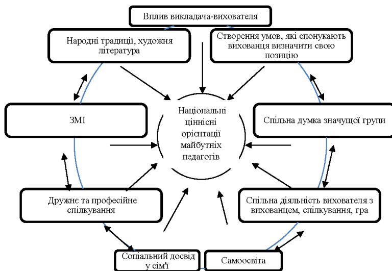
Рис. 2. Складові комплексної багатовекторної діяльності та їхня взаємодія у формуванні національних ціннісних орієнтацій майбутніх педагогів

Кожна з вищезазначених складових має специфічне змістовне навантаження та характеризується своєю спрямованістю й функціонує відповідно до власних форм здійснення (рис.2). Зміст методів кожного виду діяльності (виховання) з формування ціннісних орієнтацій студентів у закладі вищої освіти визначається через сутнісне спрямування ланок суспільної системи виховного впливу.