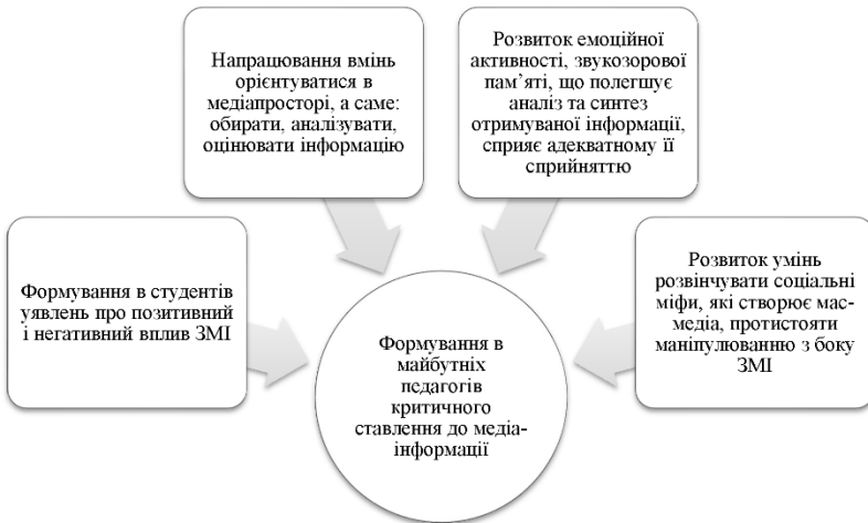
Рис. 5. Формування критичного ставлення студентів до засобів масової інформації як провідна умова ефективного формування національних ціннісних орієнтацій майбутніх педагогів

Результат медіа-освіти – сформоване стійке критичне ставлення особистості студента до медіа-інформації, що свідчить про вміння орієнтуватися в сучасному світі, у якому не останнє місце належить засобам масової інформації. Тому сформоване стійке критичне ставлення здобувача освіти до медіа-інформації можна визначити як вироблений імунітет проти інформації дестабілізуючого характеру: проти негативного впливу телебачення, радіо, інтернету тощо на ціннісні орієнтації, мораль, поведінку студентів; це вміння сприймати, аналізувати, оцінювати, переробляти, обирати