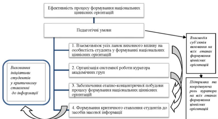
Рис. 1. Педагогічні умови ефективності процесу формування національних ціннісних орієнтацій

4. Формування критичного ставлення студентів до засобів масової інформації.