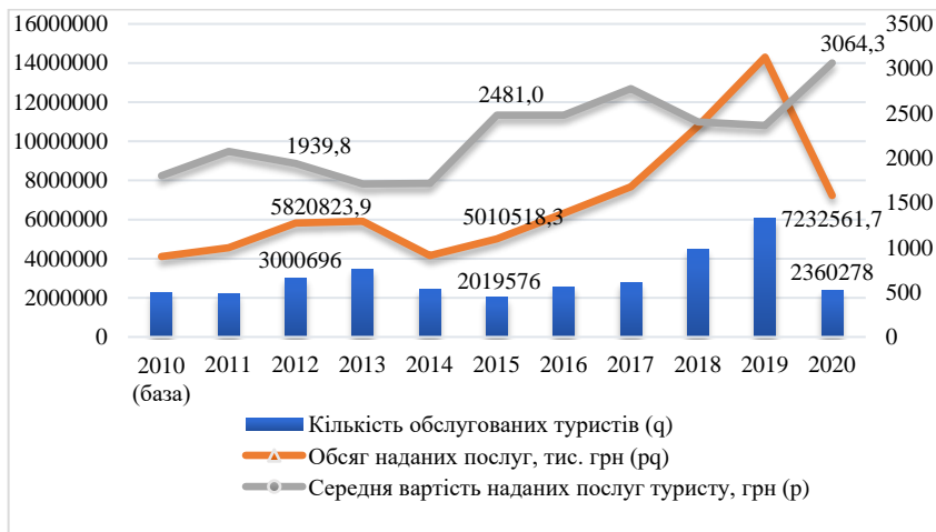
Рис. 1. Динаміка основних показників туристичної діяльності в Україні

надання послуг і зменшило обсяг на -1761028,4 тис. грн. При цьому було незначне зростання обсягів (на 0,3% або 14061,3 тис. грн) за рахунок підняття суб'єктами туристичної діяльності вартості наданих послуг.