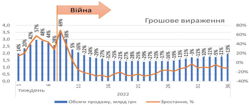
Рис. 1. Потижнева динаміка аптечного продажу лікарських засобів від 1-го до 36 тижня 2022 року [1]