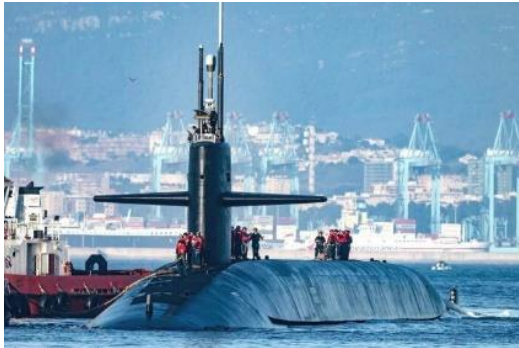
Рис. 2. CVN-78 Gerald R. Ford з авіакрилом CVW-8 та SSNB-740 «Rhode Island»

03.11.2022 Успішним ракетним пуском з Білого моря по полігону на Камчатці завершилися державні іспити рпкСП К-553 «Генераліссімус Суворов» пр.955А класу «Борей-А».