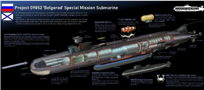
Рис. 1. Атомний підводний човен «Білгород» пр.09852

човен відомий тим, що він є єдиним носієм атомних торпед «Посейдон» за шифром «Статус-6» і поступив на озброєння у такому статусі 08.07.2022 (рис. 1).