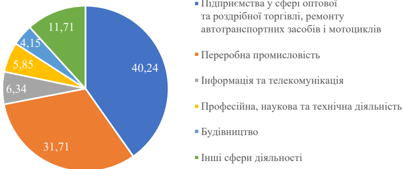
Рис. 1. Відсоток релокаційних підприємств за різними видами діяльності (від загальної кількості релокаційних підприємств)