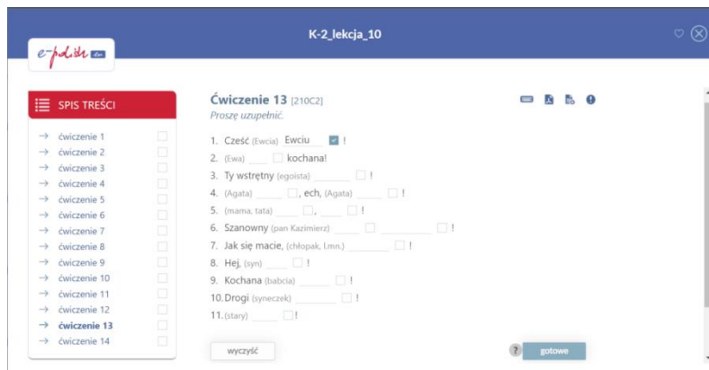
Рис. 1. Приклад вправи з платформи e-polish.eu

Мультилінгвістична платформа lingua.com – режим доступу: https://lingua.com/pl/ . Ресурс дозволяє знайти матеріали для вивчення 15 мов: англійської, німецької, польської, чеської, французької, іспанської, італійської, португальської, норвезької, турецької, нідерландської, шведської, фінської, датської, російської. За допомогою текстів і вправ до них, розміщених на цьому ресурсі, кожен охочий може визначити свій рівень володіння іноземною мовою. Кожен текст відповідає певному рівню за міжнародною класифікацією мовних рівнів. Платформа зручна у використанні тим, що є змога виконувати вправи до тексту онлайн, одразу перевіряючи їх, або завантажити текст і вправи до нього у форматі pdf. Тематика текстів є актуальною та цікавою як дітям, так і дорослим. Тексти підготовлені у вигляді коротких статей або невеликих оповідань із використанням базової лексики та нескладної граматики, що відповідають конкретному рівню володіння мовою [5].