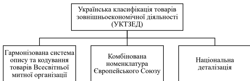
Рис. 3. Структура митно-статистичної номенклатури

УКТЗЕД як єдина митно-статистична номенклатура відповідає вимогам Всесвітньої митної організації та Комбінованій номенклатурі Європейського Союзу, які є її міжнародними основами (рис. 3).