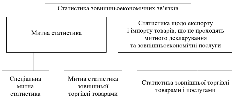
Рис. 2. Місце митної статистики у системі підгалузей статистичної науки

Митна статистика, як складова статистики зовнішньоекономічних зв'язків, враховує товари, що переміщуються через митний кордон, а також веде облік торговельних партнерів України, суб'єктів підприємницької діяльності, облік валют, контрактів та інше [1]. Крім того митниці ведуть облік та аналітику у спеціальних галузях власної діяльності, таких як виявлення випадків контрабанди та порушень митних правил, неторговим оборотом тощо. Тому митна статистика поділяється на митну статистику зовнішньої торгівлі товарами та спеціальну митну статистику (рис. 2).