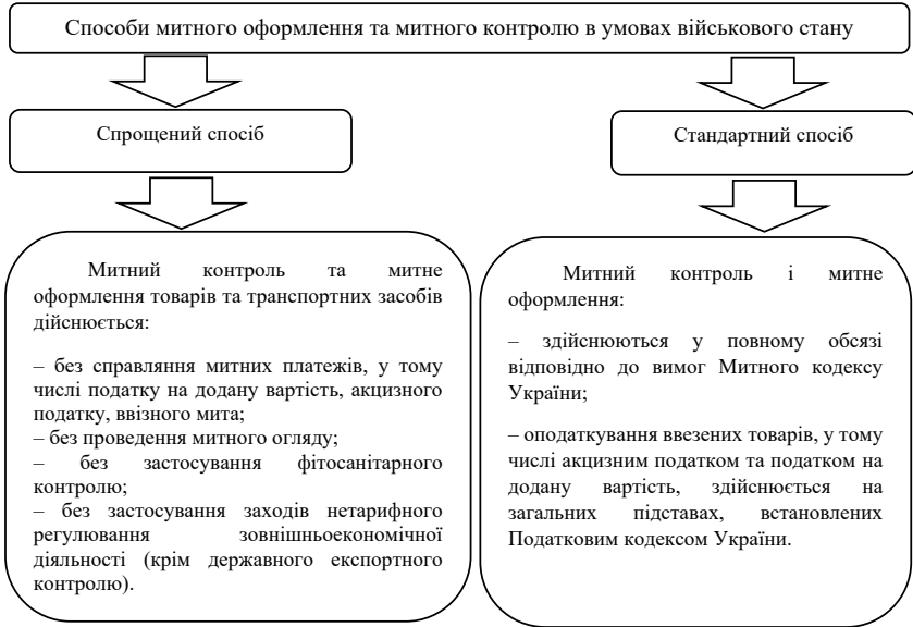
Рис. 1. Способи митного оформлення та митного контролю в умовах військового стану