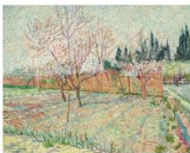
LOT 22 VINCENT VAN GOGH (1853-1890) Verger avec cyprès Estimate on request Price Realised USD 117,180,000