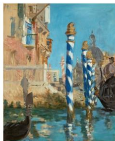
LOT 27 EDOUARD MANET (1832-1883) Le Grand Canal à Venise Estimate USD 45,000,000 - 65,000,000 Price Realised USD 51,915,000

Рекордменом цього разу стала картина Жоржа Сьора «Натурниці. Разом (зменшений варіант)» (Les Poseuses. Ensemble (petite version) 1888 р., яку придбали за $ 149 500 000 (£131 000 000)