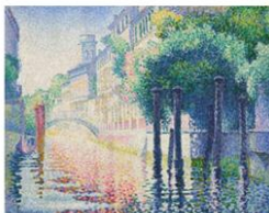
LOT 26 HENRI-EDMOND CROSS (1856-1910) Rio San Trovaso, Venise Estimate USD 2,000,000 - 3,000,000 Price Realised USD 9,550,000