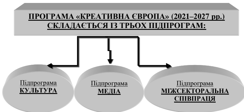
Схема 3. Структура Програми «Креативна Європа» (2021–2027 рр.) 19 .

3) третя підпрограма « Міжсекторальна співпраця » як частина Програми «Креативна Європа» була додана Європейським Союзом до Програми «Креативна Європа» на 2021–2027 роки «сприяє співпраці між різними культурними та креативними секторами, а також охоплює напрямок новинних ЗМІ» через «підтримку медіаграмотності, якісної журналістики, свободи слова та плюралізму» 18 .