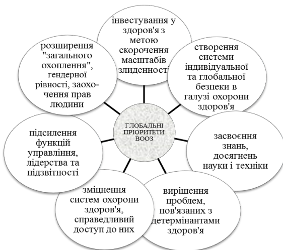
Рис. 1.2. Глобальні пріоритети Всесвітньої організації охорони здоров'я 23

На сайті ВООЗ ми можемо знайти основні сфери діяльності цієї організації. Ключовим для нашого дослідження є той факт, що ВООЗ першою сферою зазначає «системи охорони здоров'я». Визначаються наступні сфери: системи охорони здоров'я, неінфекційні захворювання, зміцнення здоров'я протягом усього життя, інфекційні захворювання, забезпечення готовності, епідагляд і відповідні заходи, корпоративні послуги 22 .