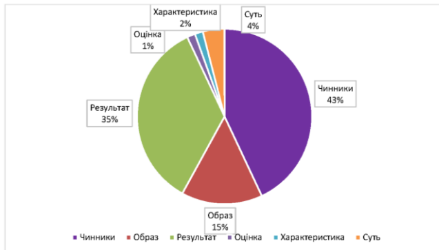
Рис. 1. Співвідношення кількісного складу когнітивних шарів (за результатами асоціативного експерименту серед української молоді)