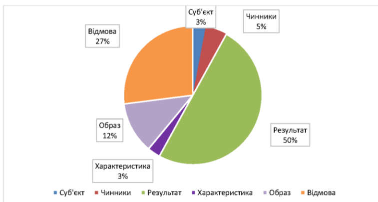
Рис. 3. Співвідношення кількісного складу когнітивних шарів (за результатами вільного асоціативного експерименту, проведеного серед людей поважного віку)

Найширше представлена група реакцій, яка формує пласт результату (що здоров'я дає людині). Більшість асоціацій є негативними: смерть, хворіти, щоб нічого не боліло, щоб ноги не боліли, щоб болячок не було . Інші пласти мають малий кількісний склад або представлені поодинокими реакціями. Загалом асоціативна семантика здоров'я дещо негативна, хоча зафіксовано як позитивні, так і нейтральні характеристики феномену.