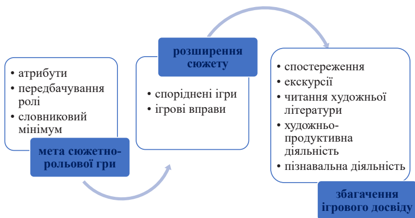
Рис. 1. Алгоритм підготовки вихователя до супроводу сюжетно-рольової гри

такої гри ініційованої дитиною, з розгортанням та урізноманітненням сюжету, тобто, довготривалої гри – підготовка досить тривала і активність її здійснення має розпочинатися саме в ранньому віці. Окрему увагу в супроводі сюжетно-рольових ігор дітей третього року життя слід приділити збагаченню ігрового досвіду, через те, що дітям, зважаючи на віковий розвиток, бракує навичок самоорганізації, планування ігрових дій, знань правил гри, способів урегулювання конфліктів або подальшого розгортання сюжету тощо. Алгоритм підготовки вихователя до супроводу сюжетно-рольової гри представлено на рис. 1.