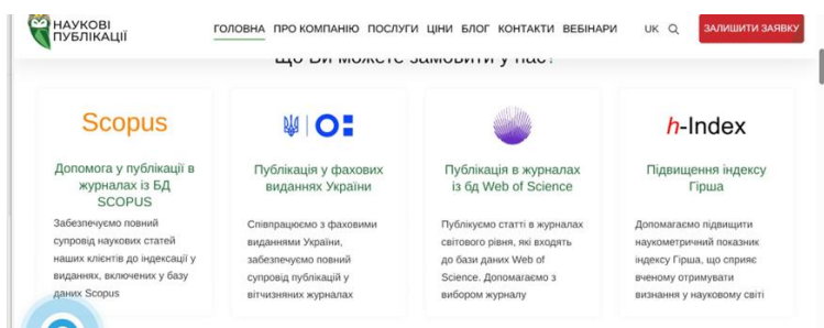
Рис. 6. Приклад комерційних послуг у сфері підготовки кадрів вищої кваліфікації

Навколо науковий ринок майорить появою нових компаній не лише щодо підготовки текстів наукових досліджень, але й їх просування, зокрема: надання редакційних послуг, оформлення наукового апарату, приведення тексту до вимог, коли, де і що публікувати, просування по різного роду рейтингам, проходження стажування і мобільності, написання грантів, ліцензійних та акредитаційних справ, актуальної інформаційної бази даних науковців, яких можна залучати до створення спеціалізованих вчених рад, редакційних колегій тощо, надання консультаційних послуг щодо порядку захистів та підготовки документів для їх проходження, ведення сторінок науковців на різного роду академічних веб-сайтах – з науковими профілями (Google Scholar, ORCID, Publon, Scopus) (див. рис. 6).