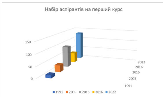
Рис. 1. Динаміка наборів в аспірантуру у ВНУ імені Лесі Українки

рази (див. рис. 1). І ситуація була досить не нормальною, оскільки університет вже на той час не потребував такої кількості наукових та науково-педагогічних кадрів. На 2015 рік викладацький склад значної кількості факультетів був на сто відсотків сформований з власних випускників як вузу, так і аспірантури. Поставало питання не лише якості у такій кількості, але й для чого ми готується цей контингент. Така ситуація, типова не лише для Волині, а загалом для України.