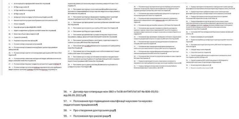
Рис. 4. Перелік нормативних документів, згідно акредитаційної справи освітньої наукової програми за третім рівнем освіти

Не менш дивним видається продовження дії постанов та нормативних актів які втратили свою чинність відповідно до листа МОН «Щодо застосування законодавства з питань присудження наукових ступенів», а також зміни до нормативних актів які не скасовують попередні норми – щодо призупинення всіх строків березень 2022 року на час військового стану,