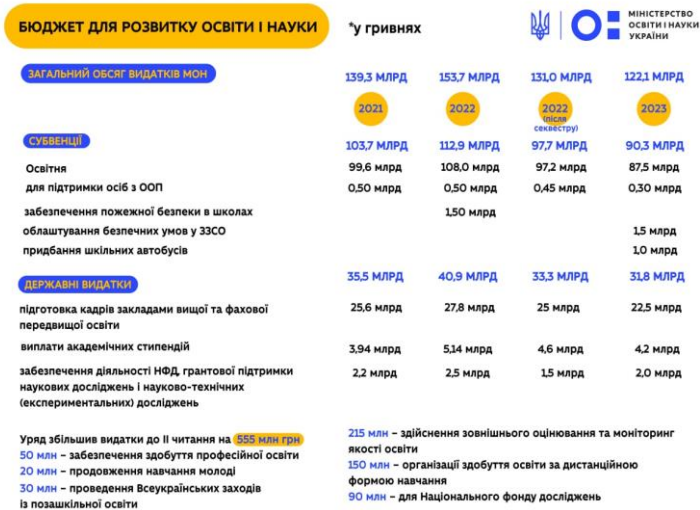
Рис. 2. Фінансування освіти і науки у Державному бюджеті України на 2023 р. 14

Зауважимо, що основними пріоритетами у 2023 році щодо підтримки наукової та науково-технічної діяльності, зокрема, є: