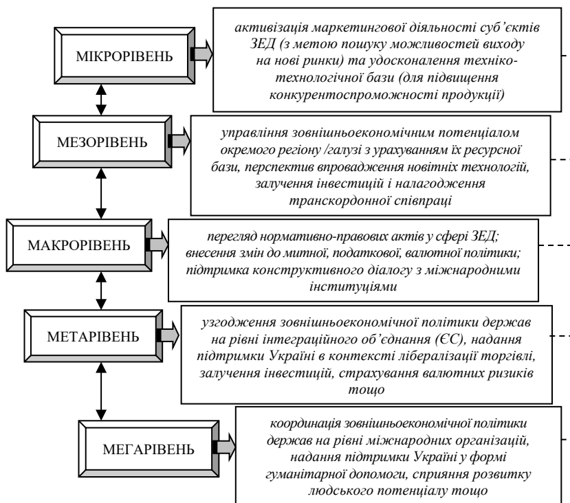
Рис. 2. Роль різних рівнів суб'єктів зовнішньоекономічної політики у виведенні зовнішньоекономічної системи з кризи, спричиненої війною

В особливий період в Україні простежується активізація регуляторних функцій різних суб'єктів ЗЕД у контексті їх участі у виведенні економічної системи з кризового стану (рис. 2). Будучи ухваленою на макрорівні, з урахуванням всіх національних інтересів, зовнішньоекономічна політика має пронизувати усі інші ієрархічні шаблі – мезо- і мікрорівень всередині системи, а також її положення повинні бути базисом у взаємовідносинах з суб'єктами мета- і мегарівня, що реалізують координаційні заходи, доречні у контексті євроінтеграційних та глобалізаційних тенденцій.