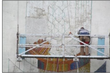
Рис. 16. Демонтаж мозаїки Г. Солдатова (2016 р.)