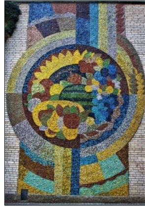
Рис. 4. Янголь О. «Щедрість осені» (1200x500, 1974 р. Вінницький національний технічний університет, м. Вінниця)

Роботи цікаві увагою до образу сучасника, ліричним трактуванням серйозних тем, прагненням через конкретні сюжети розв'язати глибокі філософські проблеми. У мозаїці «ЕОМ та навчальний процес» (рис. 5) В. Ямковенко використав для сучасної монументалістики символіко-алегоричне вираження: це техніка, яка панує в житті людини, і знання, що розвивають промисловий комплекс і суспільство, збагачують уявлення людини про навколишній світ, сприяють осягненню ролі штучного інтелекту.