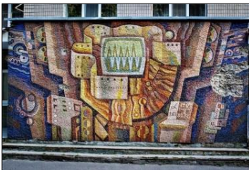
Рис. 5. Ямковенко В. «ЕОМ та навчальний процес» (300x1200, 1985 р., Вінницький національний технічний університет, м. Вінниця)

Роботи цікаві увагою до образу сучасника, ліричним трактуванням серйозних тем, прагненням через конкретні сюжети розв'язати глибокі філософські проблеми. У мозаїці «ЕОМ та навчальний процес» (рис. 5) В. Ямковенко використав для сучасної монументалістики символіко-алегоричне вираження: це техніка, яка панує в житті людини, і знання, що розвивають промисловий комплекс і суспільство, збагачують уявлення людини про навколишній світ, сприяють осягненню ролі штучного інтелекту.