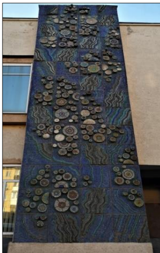
Рис. 7. Байбеков В. Декоративне панно (1200x300, 1980 р., Палац урочистих подій, м. Вінниця)