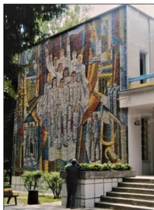
Рис. 20. Солдатов Г. Мозаїка «Молодість» (800x800, санаторій Військово-повітряних сил, м. Вінниця)

Одним із улюблених напрямків роботи Г. Солдатова є оформлення інтер'єрів та екстер'єрів наукових та навчальних установ. Ці твори складають групу, наділену рисами самостійності в системі жанрів монументального мистецтва, саме тут можна спостерігати найбільшу кількість авторських пошуків та яскравих рішень. Майстер зробив безліч ескізів мозаїк для навчальних та наукових установ Вінниччини. Це панно «Юність» (1973 р., 400x550) для Чечелівської ЗОШ I-III ступенів Гайсинського району