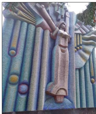
Рис. 14. Пастух Л. «Земля» (800x700, 1982 р., санаторій Військово-повітряних сил, м. Вінниця)