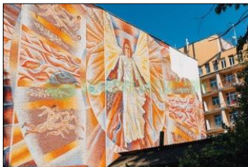
Рис. 11. Байбеков В., Каспрук В. Мозаїка «Спорт», 200х1000, 1982 р., санаторій «Поділля», м. Хмільник, Вінницька область

В. Рубіш) 20 . Під час оформлення інтер'єру використовувалася стилізація під старовину. В інтер'єрі застосовано кілька видів декоративного мистецтва (розпис по левкасу, художній текстиль, кераміка, скло), але всі вони ніби доповнюють одне одного. Стіни кафе прикрашають гобелени на тему Південного Бугу, торець – панно «Ласкаво просимо». Панно сприймається самостійно та завдяки високій майстерності художника слугує акцентом в екстер'єрі. В основі твору лежить образ дівчини-вінничанки у традиційному українському вбранні. Витонченість малюнка, орнаментальність композиції, фольклорність зображуваних метафор формують картину, у якій немає вираженого сюжету, але сам мотив дівочої краси та гостинності, м'які, округлі ритми, прозорість кольору надають їй глибокого ліризму.