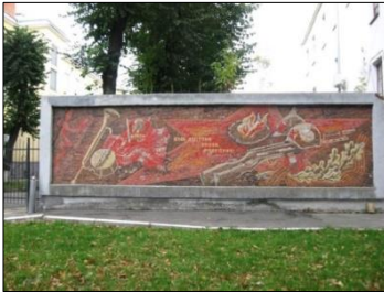
Рис. 17. Гладков С., Синпольський І. Мозаїка «Будь гідним епохи ровесником!» (робоча назва «Пам'ять») Європейська площа, м. Вінниця