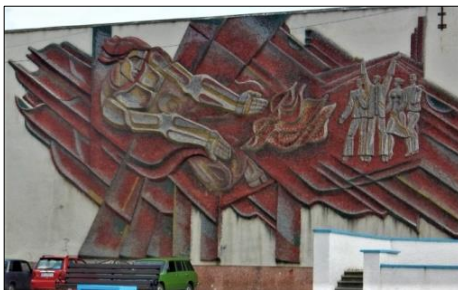
Рис. 8. Байбеков В. Мозаїка «Прометей» (300x1500, 1977 р., Палац культури, м. Ладизин)

Одними з перших монументальних робіт В. Байбекова були мозаїчне панно «Прометей» та декоративний розпис «Людина і природа» (900x330, 1976 р., левкас, темпера) для Палацу культури (колишній Громадсько-культурний центр – І.П., О.П.) Ладизинської ТЕС (1977 р.) (рис. 8). Палац побудований за типовим проєктом: він має глуху стіну, яку дуже часто відводять під монументальний розпис. В Україні образ Прометея сприймався завжди, і свідченням цього є вірші Тараса Шевченка. Для побудови композиції автор вибрав діагональне рішення. Мозаїка пронизана пафосом героїзму та жертвності, для зосередження глядацької уваги на образі Прометея автор використовує насичені кольори: червоний, жовтий, чорний. Ритмічна динаміка світлових плям додає площині відчуття свята, радісного настрою. Зображення умовне, але його вільний ритм, відкритий колір, виразність декоративної побудови наповнюють архітектурний простір вулиці людськими почуттями, життєвою активністю.