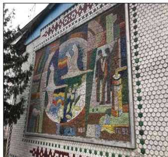
Рис. 22. Солдатов Г. Мозаїка «Будівельники» (800х800, 1992 р, Немирівський коледж будівництва, м. Немирів)

Мозаїка Г. Солдатова «Будівельники» для Немирівського коледжу будівництва, економіки та дизайну ВНАУ (1992 р.) підкрює вільним, неосяжним рухом. Автору вдалося уникнути доволі розповсюдженого в радянський період захоплення «індустріальними» формами, у його творі провідну роль відіграють люди. І в цьому значною мірою сприяло використання давньоруської символіки в поєднанні із сучасною темою.