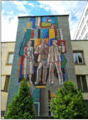
Рис. 3. Ямковенко В. «Наука» (1986 р., 1200x400, Вінницький національний технічний університет, м. Вінниця)