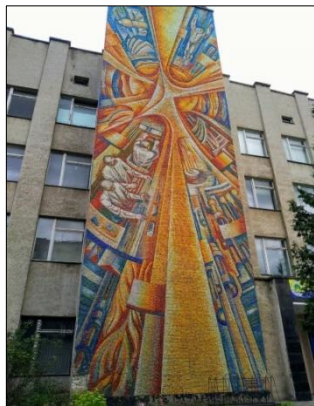
Рис. 1. Кочерган С. «Наука і космос» (виконавці Кочерган С., Олійник Д., Яблонський А.; 1990 р., 1800x700, Вінницький національний технічний університет, Вінниця)

університету прикрашає монументальний розпис А. Ступнікова «Енергетика» (1980 р.) 15 та «Студентські роки» (1982 р.) 16 .