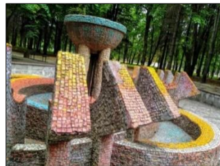
Рис. 6. Кочерган С., Олійник Д., Яблонський А. Фонтан. (1990 р., Вінницький національний технічний університет, м. Вінниця)