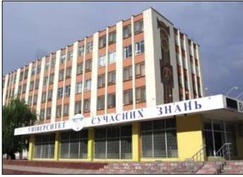
Рис. 15. Солдатов Г. Геральдична мозаїчна композиція. Колишня будівля Вінницького хімічного заводу імені В. Я. Свердлова