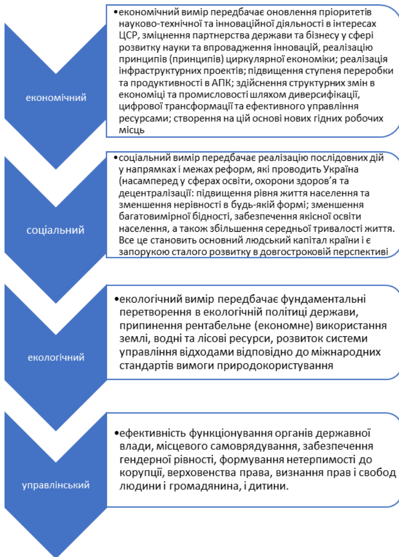
Рис. 1.1. Напрями реалізації цілей сталого розвитку України

величезних економічних затрат, створення зовнішніх і внутрішніх міграційних потоків, погіршення рівня життя.