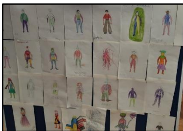
Рис. 2. Фото виставки робіт осіб з обмеженою функціональністю (результат реалізації терапевтичного заняття)

В результаті втілення проєкту педагогічно – терапевтичний колектив закладу відмітив позитивні тенденції в поведінці і настрою підопічних та повну реалізацію поставлених завдань.