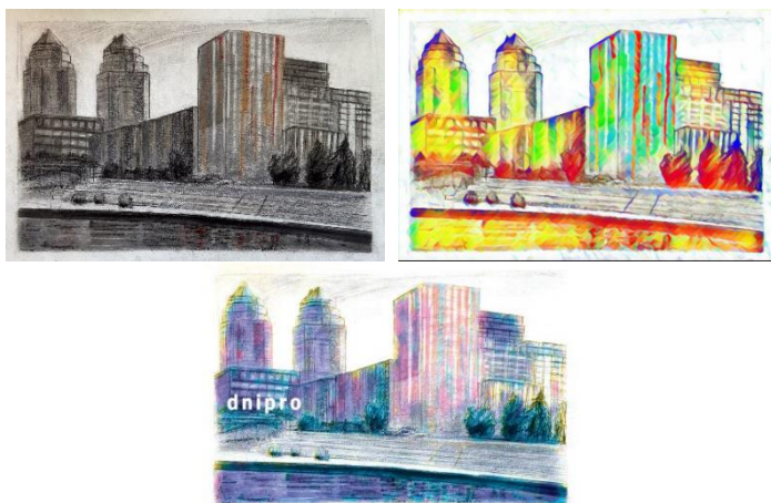
Рис. 3. Накладення фотофільтрів та кольорокорекція

інструментів, зокрема діджитал скетчінгу, як засобу подолання цих труднощів. Обговорити проблему копіювання існуючих малюнків та фотографій, і наголосити, що правильне позиціонування та досвід можуть покращити якість та розширити уяву. Робота в цифровому середовищі допомагає наочно продемонструвати студенту важливість пошуку різних варіантів вирішення творчих задач, при цьому всі ітерації зберігаються, є можливість порівняти та обрати найкращий (рис. 3).