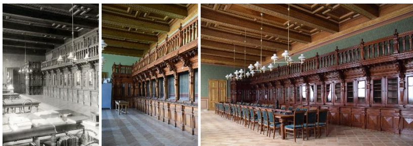
Рис. 2. Читальна зала старої студентської бібліотеки у головному корпусі Національного університету «Львівська політехніка».

поєднуються з іншим оздобленням приміщення, проте наступні перефарбування мають вже іншу кольорову гаму та є досить неохайними. На прикладі цієї читальної зали можна простежити, що середовище для навчання, в якому перебуває студент, відіграє важливу роль. Помітно, що ще на початку реставрації приміщення здавалося пустим та не мало цілісного вигляду, проте з часом, коли приміщення відновило первісний вигляд, воно стало набагато затишнішим та заповненим (рис. 2).