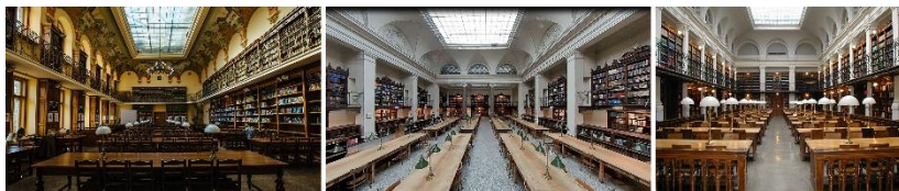
Рис. 3. Наукова бібліотека ЛНУ ім. І. Франка (зведено у 1905 р.), Університетська бібліотека в головному корпусі Віденського університету (1884 р.), Університетська бібліотека у м. Грац, Австрія (1894 р.)

допрацював інженер та архітектор Григорій Пежанський [4]. Бібліотеку споруджено за зразками університетських бібліотек Відня та Граца (рис. 3). Зокрема, для комфортного читання запроєктовано верхнє освітлення через скляний дах над великим читальним залом, також спеціальні металеві конструкції у книгосховищі, щоб мати змогу розмістити 500 тис. томів. Розписи інтер'єрів будівлі запроєктував Юліан Макаревич (1854–1936), їх виконали проф. Т. Рибковський та молодий український художник Юліан Буцманюк (1885–1967). Приміщення оздоблено стилізованими орнаментами, символічними зображеннями та латинськими і грецькими сентенціями, що нагадували про античні витoki класичного університету, пояснювали його структуру та провіщали вічне буття [4].