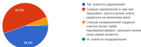
Рис. 4. Рівень задоволеності наданням освітніх послуг у державних закладах освіти