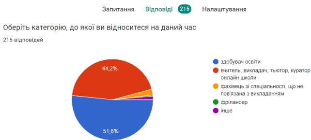
Рис. 1. залучена аудиторія респондентів

освіти. Частково проміжні результати були оприлюднено раніше в 22 та 23 . Опитування проводилося серед викладачів та здобувачів університетів, коледжів, шкіл міст Кременець, Суми, Умань, Київ. Нами свідомо обиралися великі та маленькі міста, а також заклади різних рівнів. Також було поширено форму для анкетування серед фахівців інших спеціальностей, проте більшість відповідей було отримано від учасників освітнього процесу. Опитування серед здобувачів шкіл проводилося у старших класах. Усього було долучено 215 респондентів. Розподіл респондентів представлено на рисунку 1. Серед анкетованих більшість виявилися здобувачі освіти (51,6%) та вчителів, викладачів, тьюторів (44,2%).