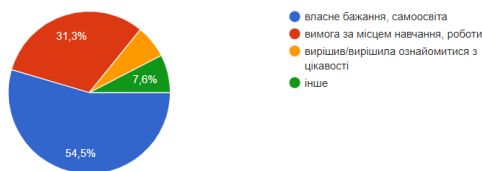
Рис. 5. Мотивація при проходженні курсів, які відносяться до неформальної освіти

Підсумовуючи результати, можна зауважити: