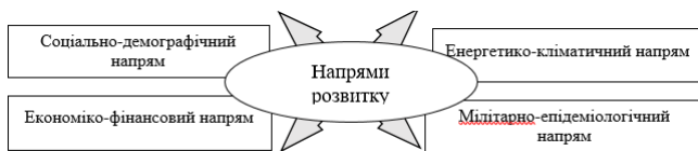
Рис. 1. Напрями розвитку України

Реальність сьогоденної України довела, що попри війну, економічну нестабільність та матеріальні втрати найважливішим залишається людина, її погляди та стремління. Переосмислення реальності формує нову людину, яка чітко планує і бере на себе відповідальність за майбутнє. На розвиток нашої країни впливає багато зовнішніх та внутрішніх факторів, які можна виділити за напрямками (рис. 1):