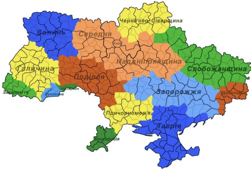
Рис. 3. Мапа історичних регіонів України в розрізі нових районів, запропонована автором

На сьогодні в Україні наявні деякі прогалини в сфері регіональної політики та децентралізації влади. До цих пір у відповідності до статті 53 Кодексу адміністративного судочинства України прокурори й досі звертаються до адміністративного суду з метою оскарження рішень місцевого самоврядування.